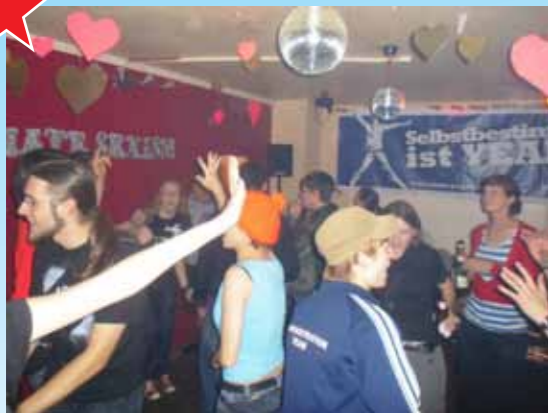
Benefizparty für den Bildungstreik

Wir sind ein pluralistischer Jugendverband und wissen, dass eine hitzige Debatte meist spannender und bereichernder ist als ein kühler Konsens.