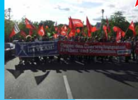
Auf der Freiheit-statt-Angst Demo 2009 in Berlin