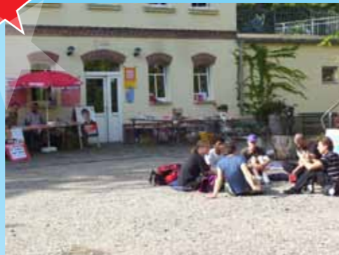
Workshop zum Thema Nationalismus im August

Außerdem war 2009 auch „Superwahljahr“ und entsprechend viele Linksjungendmitglieder und Sympathisant/innen haben sich im Wahlkampf für DIE LINKE engagiert: Flyer verteilt, plakatiert und Infostände durchgeführt. Eine eigene große Wahlkampfveranstaltung fand im August statt und war mit 450 Personen im Durchlauf sehr gut besucht. Die FDP musste sich von uns zudem bei ihrem zentralen Wahlkampfauftakt karikieren lassen.