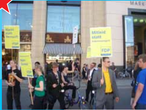
Satire beim FDP Wahlkampf