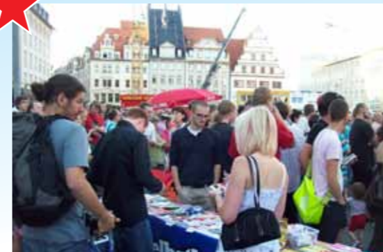
Infostand bei Gregor Gysi Auftritt

Die Linksjugend Leipzig ist ein freier Verband. Mitglieder und Sympathisant/innen können sich zusammenschließen, um ihre eigenen Projekte und Ideen zu verwirklichen. Für die Organisation der festen Termine und des Rahmenprogramms gibt es einen gewählten „Koordinierungsrat“. Sympathisant/innen haben quasi die gleichen Rechte wie Mitglieder. Die Mitgliedschaft ist kostenlos - und auch sonst ist eigentlich alles recht unkompliziert.