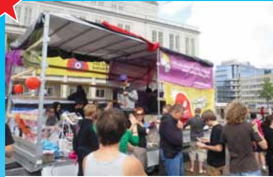
Mit eigenem Wagen bei der „Global Space Odyssee“